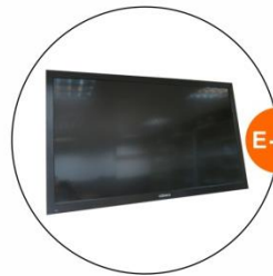
E-10 43"LCD電視機 (不包括電源插座) 43"LCD TV (Excluding Socket)