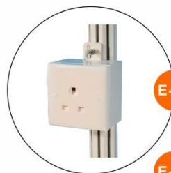
E-12 插座(不能用於照明用電) Single Phase Socket (for machine only) 1000W(220V)