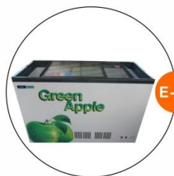
E-11 座地冷凍冰箱 (-18度)(不包括電插座) Sitting Style Refrigerator (-18°C, Excluding Socket) 1.28M(W)x0.57M(D)