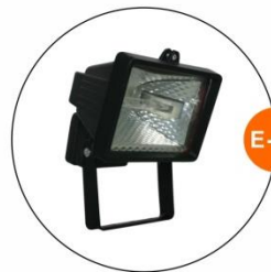
E-04 泛光燈(小太陽) Halogen floodlight 300W