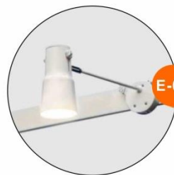
E-02 長臂射燈(白色) Long-arm Spotlight (White) 23W