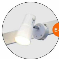
E-01 射燈(白色) Spotlight (White) 23W