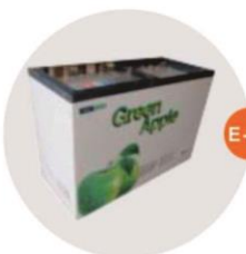
E-11 座地冷凍冰箱 (-18度) (不包括電插座) Sitting Style Refrigerator (-18°C, Excluding Socket) 1.28M(W)x0.57M(D)