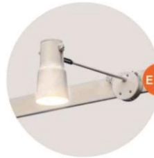
E-02 長臂射燈(白色) Long-arm Spotlight (White) 23W