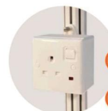
E-12 插座(不能用於照明用電) Single Phase Socket (for machine only) 1000W(220V) E-13 1500W(220V) E-14 2000W(220V) E-15 2500W(220V) E-16 3000W(220V)