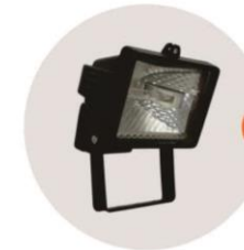
E-04 泛光燈(小太陽) Halogen floodlight 300W