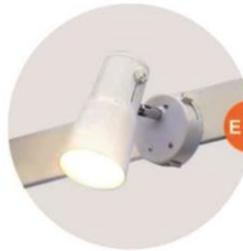
E-01 射燈(白色) Spotlight (White) 23W