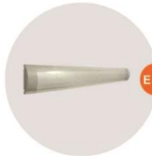
E-03 光管 Fluorescent Tube 28W