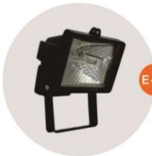
E-05 泛光燈(小太陽) Halogen floodlight 500W